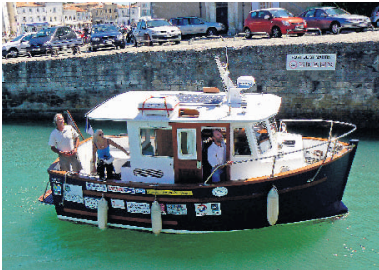
Le Spirit of Arielle entrant de le port de Saint-Martin. Le bateau a été baptisé ainsi en souvenir de l'Arielle, qui avait effectué une traversée Le Havre-New York en 1936.

Mardi 15 juillet, vers 15h. Plusieurs bateaux pavoisés entrent dans le port de Saint-Martin-de-Ré en faisant sonner leurs cornes de brume. Il ne s'agissait pas, bien sûr, de réveiller gratuitement les adeptes de la sieste. Mais plutôt de fêter l'arrivée du Spirit of Arielle.